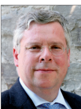
Jürgen Hardt (CDU) vertritt den Wahlkreis seit 2009 im deutschen Bundestag. Der Diplom-Volkswirt war zuvor bei einem Wuppertaler Unternehmen in der Pressearbeit tätig.