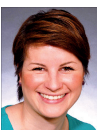
Ursula Linda Zarniko (Grüne) sitzt seit dem Jahre 2004 für die Grünen im Solinger Stadtrat und ist Referentin im Umweltministerium des Landes Nordrhein-Westfalen in Düsseldorf.

Briefe zu spät Wer am heutigen Freitag noch seine Briefwahl-Unterlagen abschickt, der riskiert unter Umständen, dass seine Unterlagen nicht mehr rechtzeitig dem Wahlamt im Barmer Rathaus zugestellt werden können. Wahlweise kann man diese aber auch persönlich am Johannes-Rau-Platz 1 abgeben.