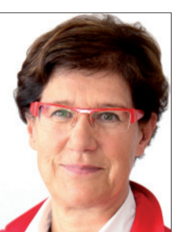
Gunhild Böth (Linke) ist Gymnasiallehrerin in Wuppertal-Barmen und war bis zur vorgezogenen Wahl 2012 Linken-Abgeordnete und Vizepräsidentin des Düsseldorfer Landtags.