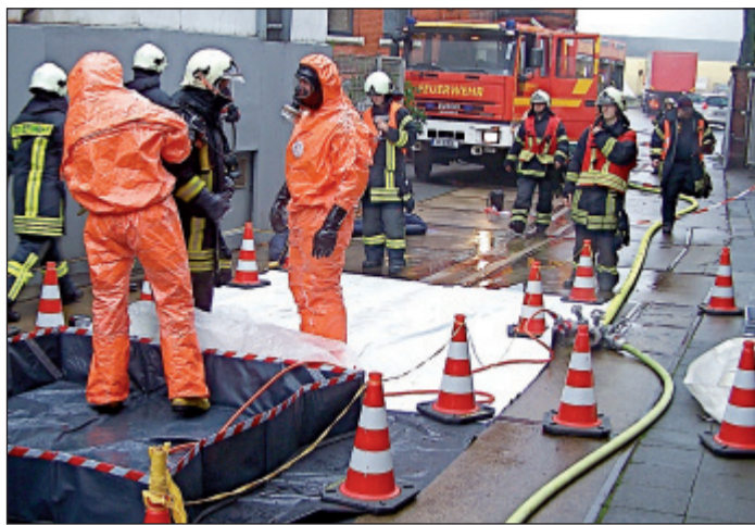
Das Feuerwehr-Großaufgebot vor dem Stahlwille-Stammstamm am der Lindenallee hatte keinen ernsten Hintergrund - zum Glück!