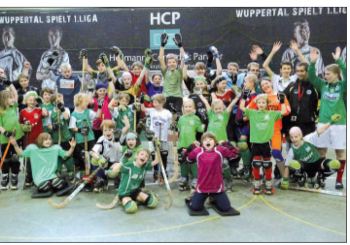
Wuppertal spielt 1. Liga HCP Wuppertal spielt 1. Liga