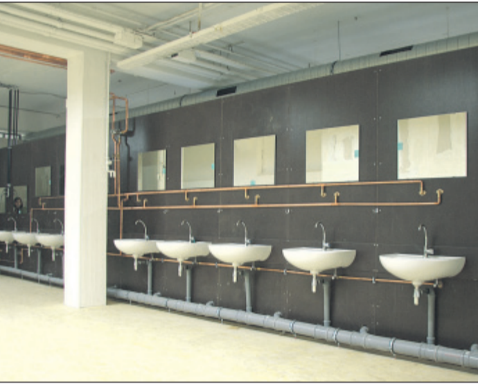
In kürzester Zeit wurden auch die Sanitäranlagen hergerichtet.

Cronenberg. Im Rahmen der Caritas-„Aktion neue Nachbarn“ gibt es auch in Cronenberg zwei sogenannte „TeeSalons“. Die Begegnungsstätte für Flüchtlinge und Cronenberger öffnet abwechselnd in der katholischen und der evangelischen Gemeinde ihre Pforten. Dienstags findet der „TeeSalon“ um 15.30 Uhr in der Hl. Ewalde an der Hauptstraße 96 statt, donnerstags hingegen zur gleichen Uhrzeit in der Friedenskirche an der Hahnerberger Straße 221.