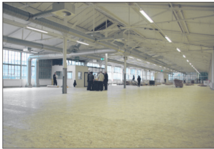
Die neu hergerichteten Räumlichkeiten an der Hastener Straße sollen als Ersatz für die Sporthallen auf Küllenhahn dienen.

In rund drei Wochen haben alle Beteiligten in Tag- und Nachtar-