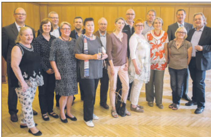
Ein Teil der Ehrenamtler des Patenprojekts Ausbildung des „Zentrums für gute Taten“ konnten am Empfang von Oberbürgermeister Peter Jung im Barmer Rathaus teilnehmen.

Stadt dankte den Ehrenamtlern des „Zentrums für gute Taten“ mit einem Empfang im Barmer Rathaus.