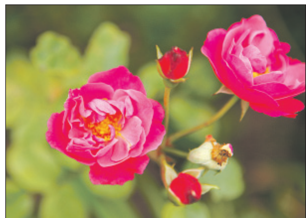
Eine große Vielfalt an Wuchsformen, eine breite und faszinierende Farbpalette, zarte Düfte: Rosen sind anspruchsvolle Schönheiten, die Pflege mit üppiger Blütenpracht belohnen.

Zweimal im Jahr ausgebracht – vor dem Austrieb und nach der Hauptblüte im Sommer – liefert der organische Festdünger von Neudorff wichtige Spurenelemente sowie bodenbelebende Mikroorganismen. Die ebenfalls enthaltenen Mykorrhiza-Pilze vergrößern zudem die Wurzeloberfläche, was die Wasser- und Nährstoffaufnahme sowie die Widerstandsfähigkeit gegen Krankheiten und Frost verbessert. So gestärkt bedankt sich die Rose mit prächtigen Blüten in satt leuchtenden Farben. (txn-p)