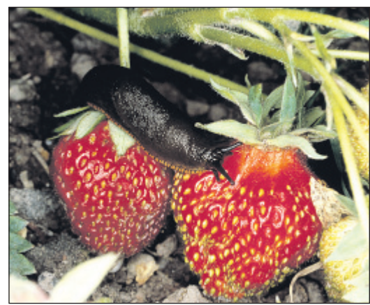
Was hilft effektiv gegen Schnecken?

Laufenten: Die Lieblingsspeise von indischen Laufenten sind Nacktschnecken. Allerdings müssen Gartenbesitzer sich um die artgerechte Haltung kümmern und das kostet Zeit.