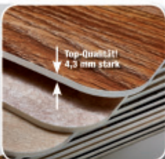
Top-Quarzlit 4,3 mm stark