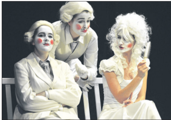
Uniform in Weiß agieren die Jung-Schauspieler des TiC-Jugend-Clubs in ihrem neuesten Stück „Burgunderprinzessin“.

Das tragische Drama, das Autor Witold Gombrowicz selbst als Komödie bezeichnet, lässt sich ge-