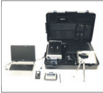
So sehen die Bürgerkoffer aus, die bei der Bundesdruckerei zu haben sind.

Wagner (SPD): „Was in Lützw geht, geht auch in Wuppertal“ Ob Fingerprint-Sensor, Scanner oder Unterschriftenpad – der 15 Kilo schwere Koffer bietet alle erforderlichen Komponenten eines Arbeitsplatzes der Meldestelle und kann quasi überall zum Einsatz kommen. Beschafft werden kann der Bürgerkoffer über die Bundesdruckerei: „Mit dem Bürgerkoffer können Kommunalverwaltungen mobile und standortunabhängige Bürgerdienste anbieten“, heißt es in einer Information der Bundesdruckerei: Zum Beispiel zu Spitzenzeiten, wie im Sommer am Einwohnermeldeamt am Steinweg, könnten die Bürgerkoffer die Verwaltung erheblich entlasten,