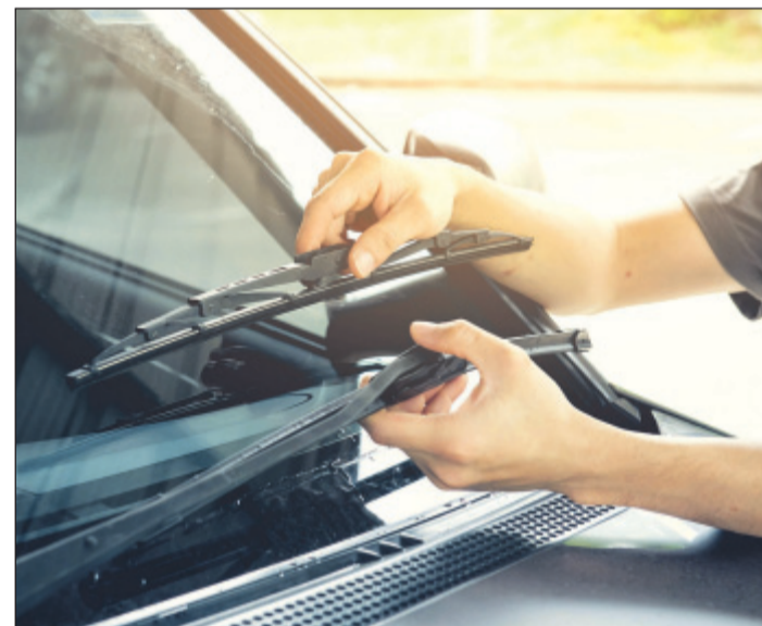
Gerade in der dunklen Jahreszeit brauchen die Scheibenwischer mehr Aufmerksamkeit.

Konsequenterweise reinigt man mit den Wischern auch die Windschutzscheibe. Kleine Unebenheiten sollten gründlich ent-