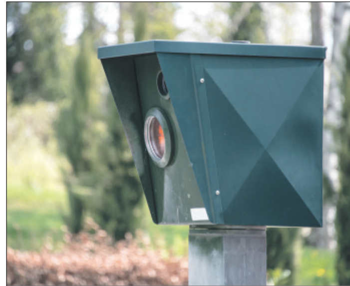
Hinweisschilder statt „Abzocke“- der AvD lehnt Geschwindigkeitskontrollen an Stellen ab, wo nur abkassiert wird.

Sind aus besonderen örtlichen Gegebenheiten doch einmal festinstallierte Messgeräte aufgestellt, sollte immer auch auf den