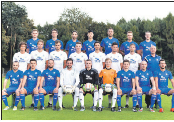
Aufsteiger SSV Germania 1900 rangiert nach dem siebten Spieltag auf Platz 10 in der Kreisliga A-Tabelle.

Dadurch verbesserten sich die Sudberger auf Platz 11 in der Tabelle der Kreisliga A. Am Sonntag sollten die Schwarz-Blauen erneut