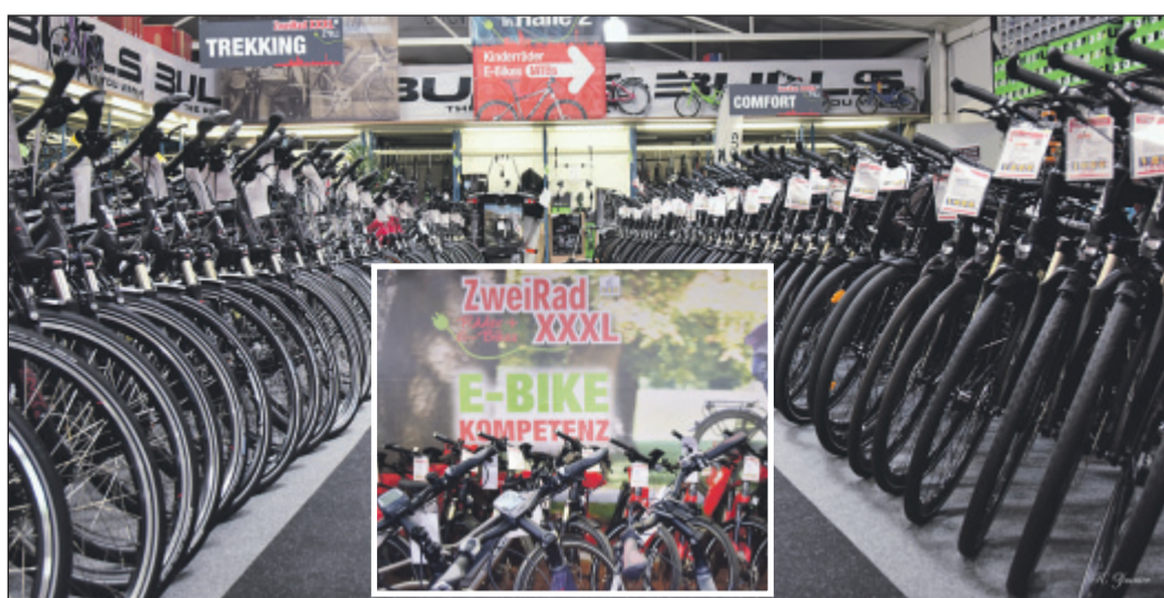
Das ZweiRadHaus Eller bietet nicht nur Top-Auswahl und kompetente Beratung. Hier stimmen auch Service und Preis.

Auf über 1.000 Quadratmetern Verkaufsfläche bietet ZweiRad-XXXL des ZweiRadHauses Eller im gleichnamigen Düsseldorfer Stadtteil die gesamte Zweirad-Palette an und ist damit einer der größten Fahrradhändler in der Umgebung und DER größte in Düsseldorf. Als Mitglied der Zweirad-Einkaufsgenossenschaft (ZEG) profitiert ZweiRad-XXXL von den immensen Einkaufsvorteilen dieses Verbandes, die man gerne auch an die Kunden weiter gibt. Kein Wunder also, dass man hier immer ein großes Angebot und viele attraktive Schnäppchen machen kann.