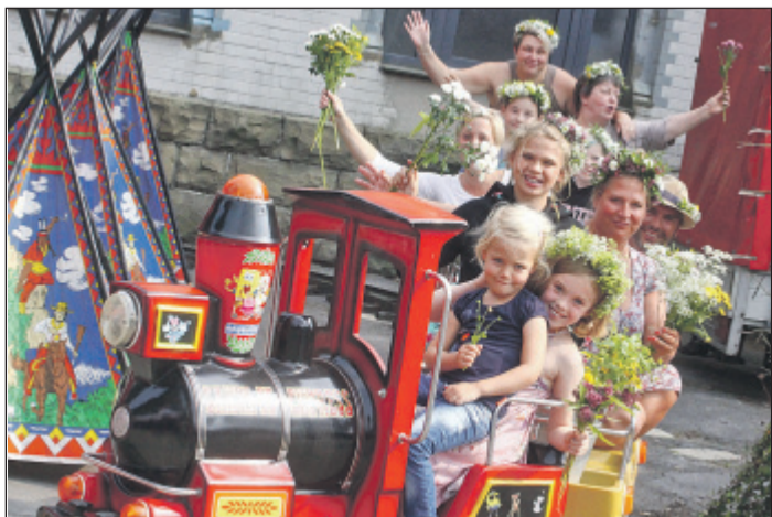
Am Hofffest-Nachmittag waren an der Küllenhahner Straße zunächst Sparkassen-Eisenbahn fahren und Blumenkränze binden angesagt, am Abend dann wurde zur Musik von DJ Bert kräftig bis in die Küllenhahner Nacht abgetanzt.