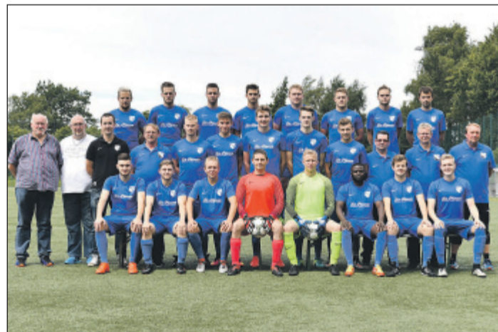
Das Team des neuen B-Kreisligisten SSV Sudberg hat einen „holprigen“ Start in die Spielzeit 2017/18 hingelegt.