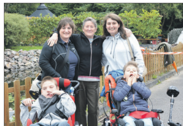
Einige der Gäste des Kinderhospizes Burgholz bei ihrem Besuch des Hahnerberger Feuerwehr-Festes.

den Auftritten des Tanz- und Bewegungscenters „MoveAttack“.