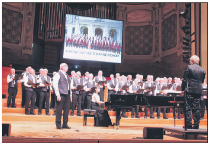
Der Organisator als Mitwirkender: Der „Cronenberger Männerchor“ bei seinem Auftritt am Abend der Chornacht.

Nachdem zusammen mit den Gästen „Kein schöner Land“ erklungen war, folgten am Abend die Ensembles „Mixed Harmonie“, der „Polizeichor Wuppertal“ und um 19.30 Uhr wurde der Staffeltab dann an „Ladies Harmonie“ weitergegeben, die unter anderem „Ich will keine Schokolade“ im Repertoire hatten. Dazu ließ der Chor keine Schokoladen-Tafeln ins Publikum fliegen, vielmehr wurden kleine Plüschteddys ins Publikum geworfen – auch so geht Unterhaltung!