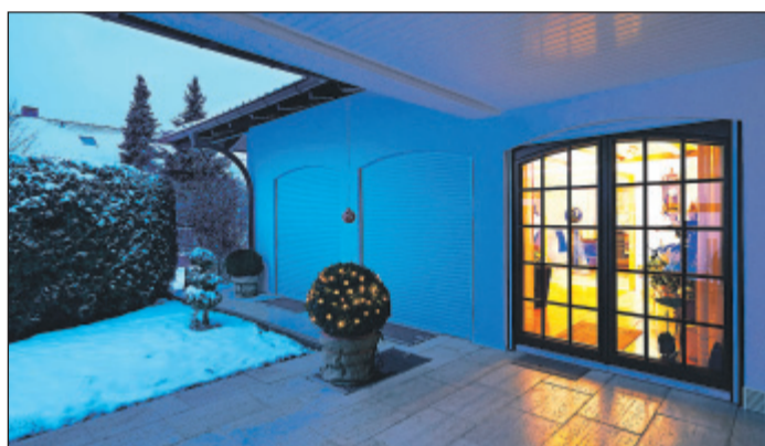
Automatisch gesteuerte Rollläden können die Wärmedämmung an den Fenstern im Winter deutlich verbessern.

Trotz Automatisierungstechnik sollte der Anwender natürlich die