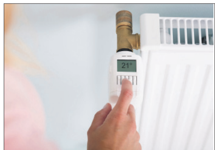
Programmierbare Thermostate sorgen dafür, dass nur zu vorab eingegebenen Zeiten geheizt wird – auch so lassen sich die jährlichen Energiekosten effektiv reduzieren.

Auch in der kalten Jahreszeit sollte man immer wieder durchlüften. „Statt das Fenster ständig in Kippstellung zu lassen, sollte man besser regelmäßig kurz und kräftig lüften“, so Kampwirth. Das sorgt für genügend Frischluft und man verliere weniger Energie. Wei-