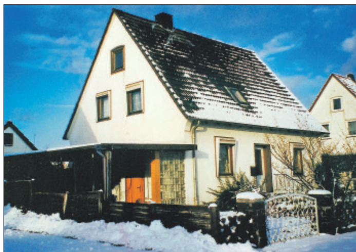
Bei Sanierungsprojekten beispielsweise sind sowohl eine umfassende Sanierung zum Effizienzhaus als auch Einzelmaßnahmen förderfähig.

Vielfältige Bauteile, Techniken, gesetzliche Vorgaben und Fördermöglichkeiten machen Hausbau und Sanierung zu einem komplexen Projekt. Zur Planung empfiehlt sich für Bauherren und Hauseigentümer daher sowohl eine Erstberatung durch die Verbraucherzentrale wie auch das Hinzuziehen eines Energiefachberaters. Er klärt, ob es genügt, im ersten Schritt den Energieverbrauch durch eine Dachdämmung aus Mineralwolle zu senken oder ob man auch noch Fassade und Fenster anfassen sollte.