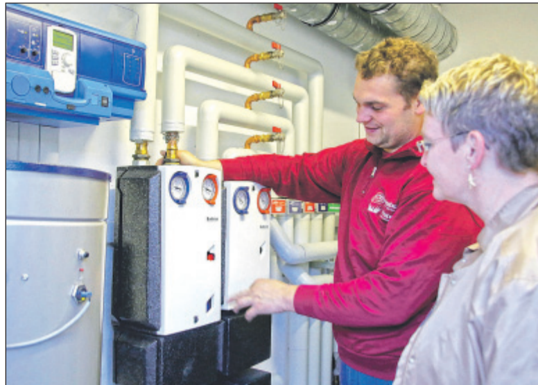
Ein Heizungs-Check vor dem Winter stellt sicher, dass die Heizung zuverlässig funktioniert und sparsam läuft.

Bei einem Vor-Ort-Termin zum Wintercheck kann der Heizungsfachmann Angebote für eine neue Heizung konkretisieren. Auch wenn es für einen Tausch vor dem Winter wahrscheinlich schon zu spät ist, kann man so eine Heizungsmodernisierung frühzeitig planen und in Ruhe überdenken. Besonders bei älteren Brennern lohnt sich ein Tausch. Der Umstieg auf Brennwerttechnik mit dem gleichen Brennstoff ist meist vergleichsweise günstig. Wer fossile Energieträger aus dem Haus verbannen und auf erneuerbare Energien etwa mit einer Wärmepumpe umsatteln möchte, muss etwas tiefer in die Tasche greifen. „Auf jeden Fall sollte ein verbindliches Komplettangebot ohne versteckte Zusatzkosten vorgelegt werden“, empfiehlt Schreiber. (djd).