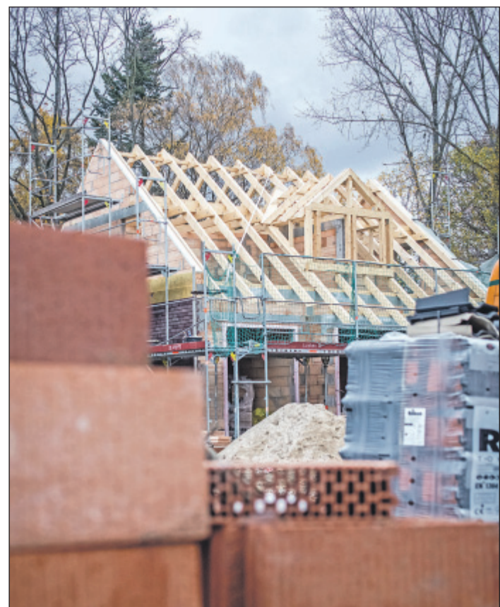
Die Auswahl der Baumaterialien, zum Beispiel der Dämmstoffe, bestimmt maßgeblich, wie groß der „ökologische Fußabdruck“ eines neuen Hauses auf Dauer ausfällt.

Laut Neuert steht und fällt der Nutzen von natürlichen Dämmmaterialien letztlich mit einer versierten Fachplanung und der Ausführung durch kompetente Baufirmen. Interessierten privaten Bauherren rät er, etwas Mühe und Aufwand zu investieren, um Architekten oder Hausanbieter zu finden, die sich dem umweltschonenden Bauen verschrieben haben. Bei der Suche nach den richtigen Baupartnern und der Bauausführung kann auch der Bauherren-Schutzbund Modernisierer und Bauherren durch seine ökologische Bauberatung und durch baubegleitende Qualitätskontrollen unterstützen.