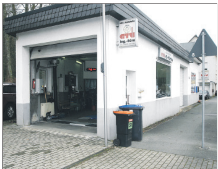
Prägt das Bild in der Kohlfurth seit Jahren: die GTÜ-Prüfstelle Jöker.

Telefonisch erreicht man die Kfz-Profis unter (01 70) 5 88 01 90 oder unter 2 47 21 22 (während der Geschäftszeiten). Ihre Prüfstelle findet man an der Kohlfurthener Brücke 54 - gleich neben dem Motorrad-Spezialisten MSM.