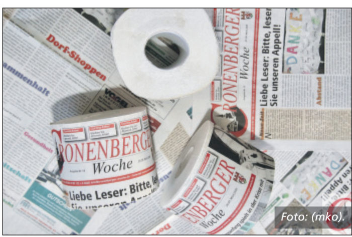
So sehen sie aus, die ersten (aufgerollten) „Dummies“ der neuen CW – übrigens in vierlagig und mit ultrasofter Papier-Qualität...

reich ist. Schließlich, so dachten wir, haben wir ja Papier genug (sprich 16.000 CWs jede Woche) – warum das nicht nutzen, warum nicht aus der Not eine Tugend machen? Und zwar eine, die das bisherige Erscheinungsbild unserer Zeitung verändern wird. Der Inhalt unserer Zeitung bleibt (hoffentlich auch in Ihren Augen) von gleicher Qualität?! Aber wir werden die CW in Kürze in veränderten Papier-Qualitäten herausbringen – und zwar mindestens zweilagig! Die Details mit unserer Druckerei sind längst abgeklärt, pünktlich zum nahenden Osterfest wird „die neue CW“ erstmals erscheinen – sozusagen unser Oster-Präsent für Sie, liebe Leserinnen und Leser! Was das soll? Wir wollen mit unserer (hoffentlich ebenso innovativen wie zündenden) Idee zwei Fliegen mit einer Klappe schlagen: die aktuelle Klopapier-Krise und unsere eigene in einem Aufwasch (oder besser: einem Abputzvorgang) erledigen! Zwar wird die neue CW in der Grundvariante (zweilagig und mit Perforation) weiterhin kostenfrei sein – wir wollen und werden auch weiterhin kostenfrei in Ihrem Briefkasten landen oder zur Mitnahme ausliefern!