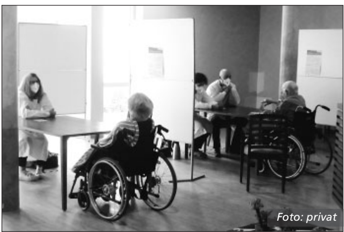
In der Cafeteria konnten die Bewohner des Evangelischen Altenzentrums Cronenberg am Eich mit ihren Angehörigen ein Wiedersehen feiern – natürlich mit viel Abstand und Maske...

Cronenberg/Südstadt. Die „Umsetzung des NRW-Erlasses innerhalb weniger Tage war durchaus „sportlich“, heißt es zwar vom Caritas-Verband. Aber: Ob bei den beiden Caritas-Altenzentren in der Südstadt oder dem Evangelischen Altenzentrum Cronenberg, überall klappte es mit der Lockerung des Corona-Besuchsverbotes. Die hatte NRW-Gesundheitsminister Laumann eigentlich am 5. Mai für den vergangenen Muttertag-Sonntag verkündet. Noch am Freitagabend allerdings kam aus Düsseldorf die Nachricht, dass Altenheim-Besuche schon wieder am Samstag möglich waren – ob der zahlreichen Besuchswünsche, die nach der Lockerung-Ankündigung zu „Terminstaus“ in manchen Einrichtungen geführt hatten, hatte das NRW-Ministerium die Teilöffnung einen Tag vorgezogen.