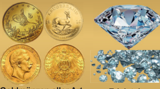
Goldmünzen aller Art Edelsteine

Alt- und Bruchgold Wir kaufen Uhren aller Art: Rolex, Patek, Philipp, Omega usw.