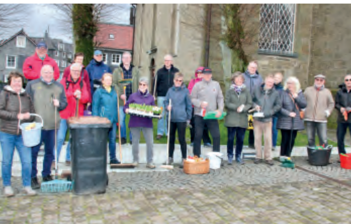
Die „Picobello“-Helfer des CHBV trafen sich zum stärkenden Finale auf dem Kirchplatz (li.) und die im Norden am „Küllenhahner Lädchen“ (re.),...