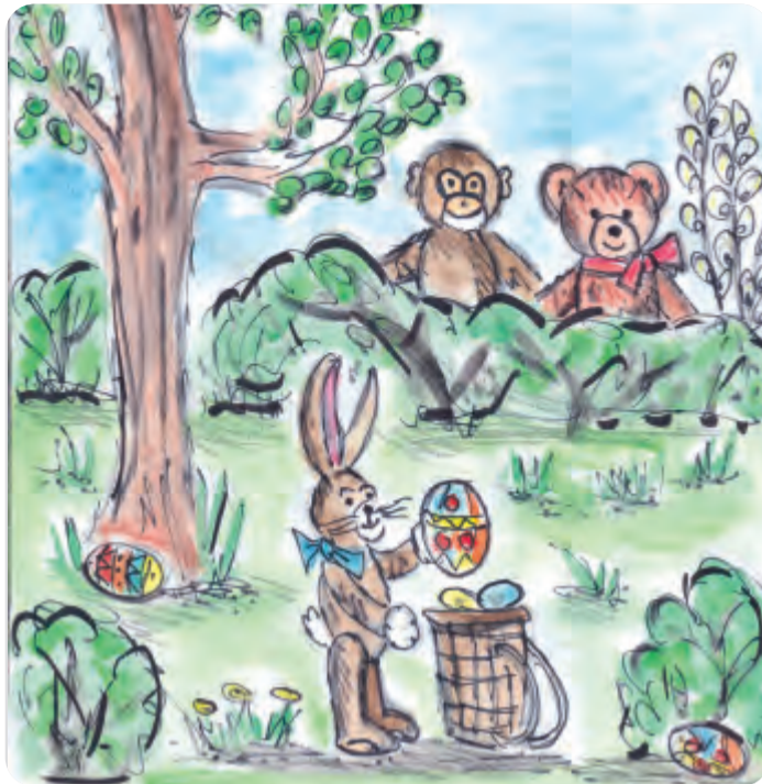
Coco und Andy beobachten den Osterhasen ganz genau. Dieses Mal wird ja wohl nichts schief gehen...

Zum Glück waren Coco und Andy in der Nähe, die beobachten konnten, wie sich ein Dieb an jedes Versteck heran schlich und alle Eier stahl. „Es war ein ganz besonderer Dieb“, erinnert sich Andy. „Nämlich eine Elster.“