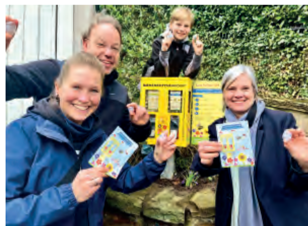
Einige der Aktivisten des ersten Bienenfutter-Automaten Wuppertals an der Jägerhofstraße 39 in der oberen Südstadt.

Nachhaltigkeit wird übrigens auch bei den Mehrweg-Kapseln groß geschrieben: Sie sollten in einen Rückgabe-Behälter neben dem Automaten zur Wiederverwendung geworfen werden. Die Kapseln werden in einer Integrationswerkstatt mit Samenmischungen beziehungsweise mit Krokuszwiebeln neu befüllt und an die einzelnen Automaten-Standorte verschickt.