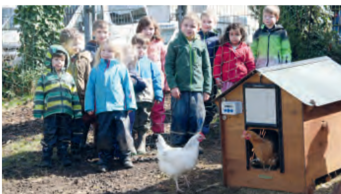
bei den vorbeikommenden Spaziergängern am Friedenshain...! Mehr Infos zu den Leih-Hühnern unter www.chickenontour.de. |

„Fest steht: Die fünf Hennen waren der absolute Star nicht nur bei den Kindern, sondern auch