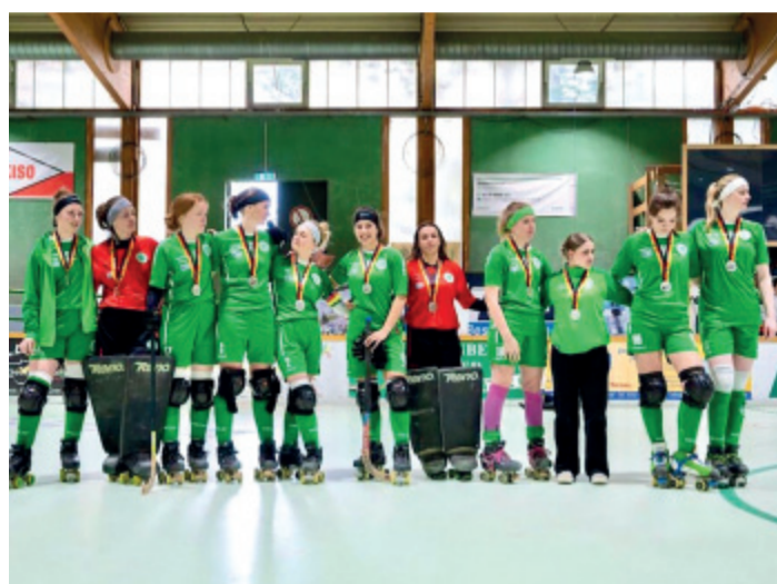
Das Team Dörper Cats des RSC Cronenberg holte in der Rollhockey-Saison 2022/23 nicht nur den Pokalsieg, sondern auch die Vizemeisterschaft an die Ringstraße.

Das Team aus dem Norden Spaniens ist zwar international noch unbeschrieben. Die mit hochkarätigen Spielerinnen gespickte Mannschaft belegte in der abgelaufenen Saison aber Platz 6 in