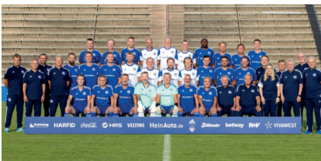
Lassen nicht nur die königsblauen Fußball-Hezen höher schlagen: Olaf Thon und seine Knappen-Legenden in der Traditionsmannschaft des FC Schalke 04 besitzen in ganz Fußball-Deutschland Kultstatus.

„Titel, Tränen und Triumphe“, so umreißen sie selbst ihre bald 120-jährige Geschichte – die Königsblauen des FC Schalke 04. Auch wenn nach dem Abstieg aus der Bundesliga aktuell eher Tränen angesagt sind, lebt der Schalke-Mythos unverändert. Königsblau ist schließlich für die Fans eine Art Religion, „Wir lieben dich“, lautet ja ihre Devise.