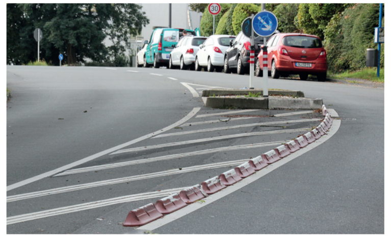
Ein Dorn im Auge vieler, die gen Sudberg unterwegs sind, die Verkehrsinsel an der Berghäuser Straße.

CRONENBERG. Wuppertal hat sich nicht nur durch „goldene Bänke“ bundesweit der Lächerlichkeit ausgesetzt. Da gibt es noch ganz andere Sinnlosigkeiten! Wenn sich Wuppertaler Verkehrsplaner einmal für etwas entschieden haben, halten sie daran fest. Egal, ob das Sinn macht oder großer Unsinn ist... Im Stadteil Cronenberg errichtete man vor einiger Zeit auf der Berghäuser Straße eine Verkehrsinsel. Der Grund war eine beabsichtigte Haltestellenverlegung von der Rottsieper Höhe dort hin. Nachdem die Verkehrsinsel fertig war, stellte man fest, dass der Bürgersteig zu schmal für die Fahrgäste sein würde und eigentlich auch die Straße für eine Verkehrsinsel mitten auf der Fahrbahn. Die Verkehrsbetriebe WSW nahmen daraufhin Abstand von der Haltestellenverlegung. Die Verkehrsinsel blieb jedoch bestehen. Keiner bedachte, dass zu bestimmten Jahreszeiten an dieser Stelle die Sonne so tief steht, dass man die Verkehrsinsel nicht sieht. So kam es bisher zu mindestens sieben Unfällen, indem Autofahrer die Insel praktisch „blind“, überfahren und teilweise sogar Totalschäden am Fahrzeug verurben mussten. Die Stadt Wuppertal ist bisher trotz Widersprüchen von Politikern und Bürgern nicht bereit, diese vollkommen sinnlose Verkehrsinsel ins