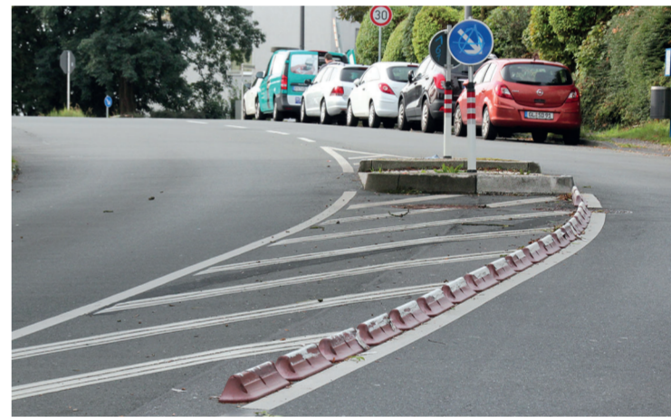
Ein Dorn im Auge vieler, die gen Sudberg unterwegs sind, die Verkehrsinsel an der Berghäuser Straße.

Die Verkehrsinsel blieb jedoch bestehen. Keiner bedachte, dass zu bestimmten Jahreszeiten an dieser Stelle die Sonne so tief steht, dass man die Verkehrsinsel nicht sieht. So kam es bisher zu mindestens sieben Unfällen, indem Autofahrer die Insel praktisch „blind“, überfahren und teilweise sogar Totalschäden am Fahrzeug verbrachten mussten. Die Stadt Wuppertal ist bisher trotz Widersprüchen von Politikern und Bürgern nicht bereit, diese vollkommen sinnlose Verkehrsinsel ins