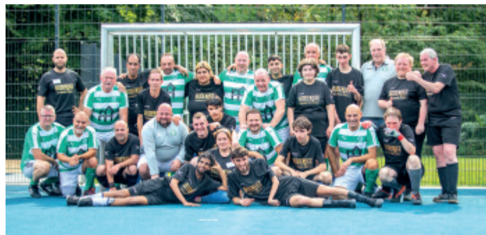
Gelebte Inklusion: Im ersten Spiel auf dem neuen Sportplatz an der Heidestraße erkämpfte sich die Fußballmannschaft der Lebenshilfe ein beachtenswertes 6:6-Unentschieden gegen die Altherren des Cronenberger SC.

ORTSMITTE. Ab heute erweitert „Erdy's Burger & Pizza“ in der Ortsmitte sein Kulinarika-Programm: An der Hauptstraße 20 gibt es nun auch Kalbs-Döner. Zur Eröffnung, nur am heutigen Freitag, ist der leckere Schmaus für sage und schreibe nur 99 Cent zu haben.