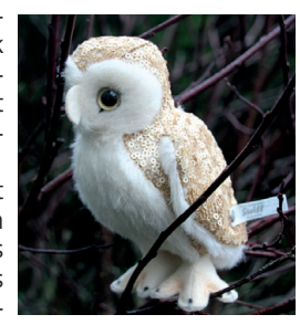
habt ihr noch nie gesehen“, berichtete die Eule weiter. „Dann gibt es hier auch Kobolde, die sich um die Pflanzen kümmern.“