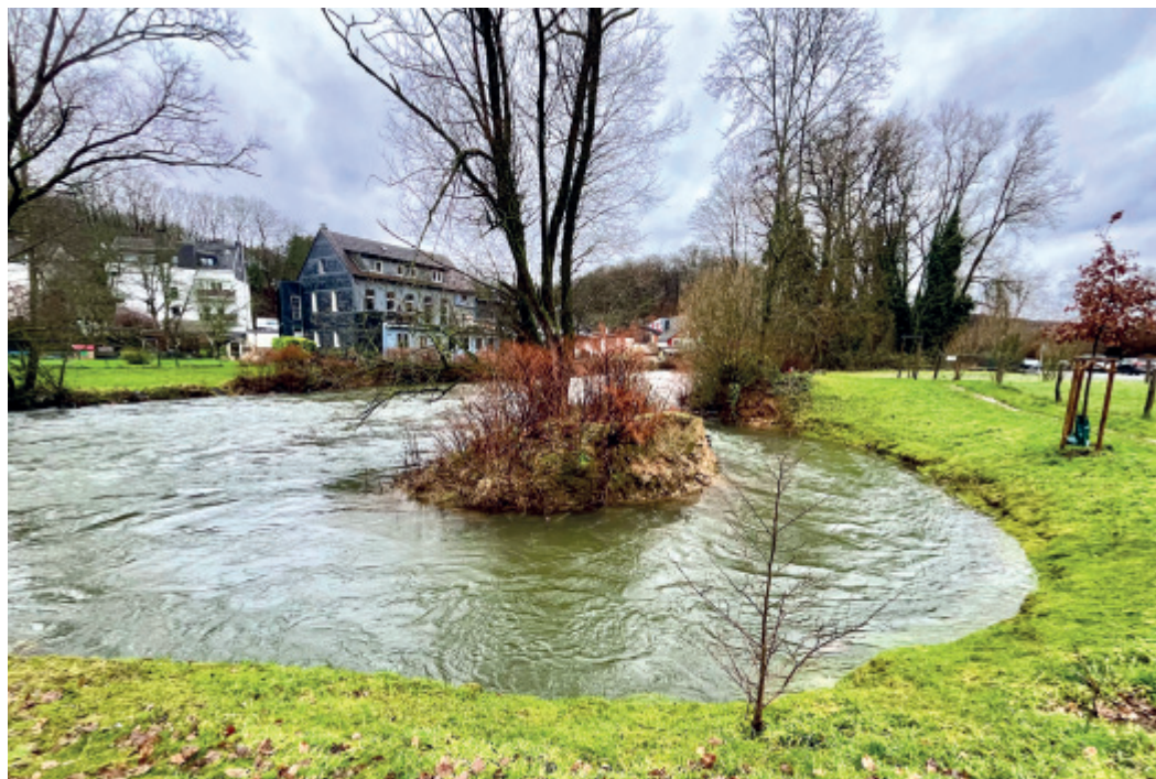
„Berger Islands“ in der Kohlfurth, von der angeschwollenen Wupper kräftig „umrauscht“, musste durch die Wassermassen einmal mehr etwas an „Inselmasse“ dem Bergischen Amazonas abtreten...

WUPPERTAL. Wenn wir es nicht bereits geahnt hätten...: Der Dezember war ein überdurchschnittlich nasser Monat. Nachdem bereits Oktober und November sehr feucht waren, gab es laut Wupperverband zum Jahresfinale kaum einen trockenen Tag – im gesamten Monat regnete es teils doppelt so viel wie sonst in einem Dezember. An der nächstgelegenen Wupperverband-Messstation zum CW-Land, der Kläranlage in Buchenhofen, lag die Regenmenge bei 216 Litern pro Quadratmeter – in einem durchschnittlichen Dezember fällt hier mit 121 Litern nur knapp die Hälfte an Niederschlag. Damit war der vergangene Monat an der Kläranlage Buchenhofen der nasseste Dezember seit 1994. Das war aber noch längst nichts im Vergleich zur Messstation Brucher-Talsperre in Marienheide: Dort wurden sogar 309 Liter Niederschlag gemessen – damit war die Brucher Talsperre die nasseste Messstation im gesamten Wupperverbandsgebiet. Zum Vergleich: Am trockensten war es an der Kläranlage Leverkusen mit 104 Litern. Aber auch hier lag die Niederschlagsmenge deutlich über dem Durchschnitt – dieser liegt bei 82 Litern.