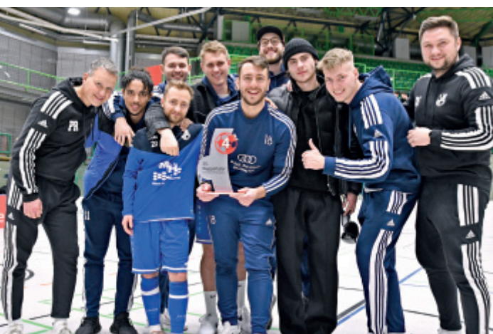
Hatten ebenfalls Grund zur Freude: „Lokalmatador“ SSV Germania 1900 wurde unweit des heimischen Freudenbergs Vierter.