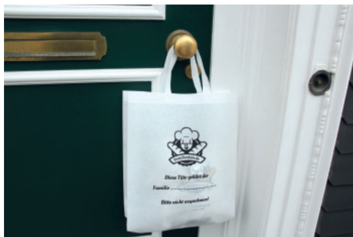
Wenn am Wochenende dieser Stoffbeutel bis um 8 Uhr an der Türklinke hängt, war der Brötchenbote da und das Frühstück kann beginnen.

Wer einen Neukunden empfiehlt, erhält auf seinem Kunden-