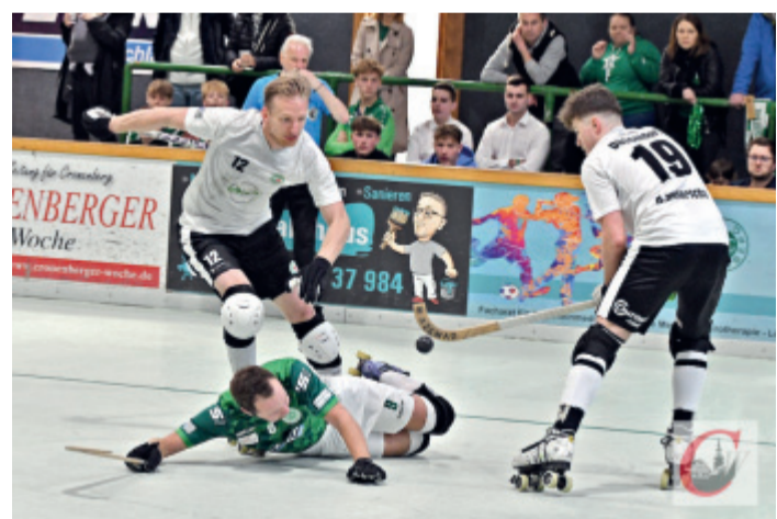
Keine Szene mit Symbolkraft: Im ersten Play-off-Halbfinale setzten sich die Löwen des RSC Cronenberg überzeugend gegen den TuS Düsseldorf-Nord durch. | Foto: Odette Karbach

Die Dörper Cats haben es geschafft – die RSC-Löwen sind auf einem guten Weg dorthin! Gemeint sind die Play-off-Finals um die deutschen Rollhockey-Meisterschaften 2023/24: Während die Rollhockey-Damen des RSC Cronenberg am vergangenen Samstag mit einem 7:5-Heimsieg (5:2) gegen den SC Moskitos Wuppertal bereits das Ticket für die Endspiele lösten, haben die RSC-Herren mit einem 6:0 im ersten Halbfinale gegen den TuS Düsseldorf-Nord einen großen Schritt dorthin gemacht.