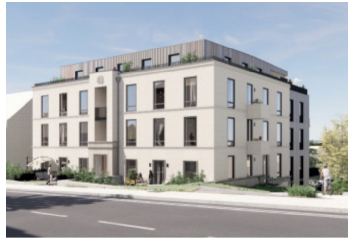
Das „Cronenberg-Wohntraum“-Projekt in Berghausen von der Vorder- und Rückseite gesehen.