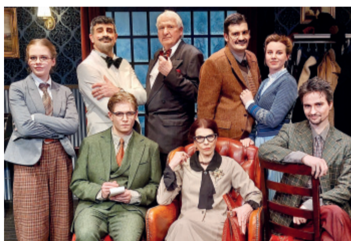
Eine geheimnisvoll-undurchsichtige Gesellschaft: das Ensemble des Agatha-Christie-Krimis „Die Mausefalle“ im TiC-Theater.

Stichwort Mr. und Mrs. Ralston: Die Eheleute, die frisch im ererbten Haus die Pension eröffnet haben, sind bei Dabek und Bangen ordentlich und auch schon bürgerlich-gesetzt. Schon früh deutet sich an, dass sie nicht gerade vor Leidenschaft füreinander verge-