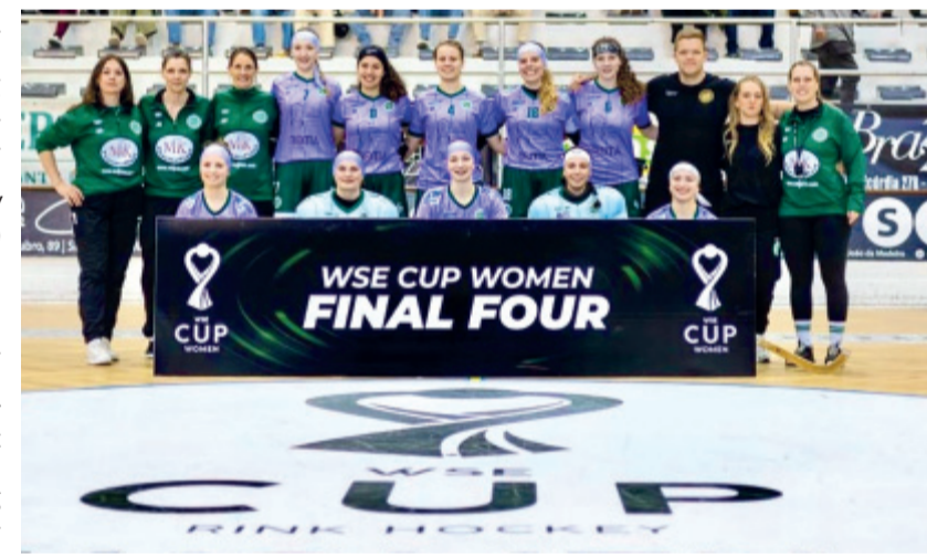
Verkauften sich teuer und vertraten die deutschen Rollhockey-Farben bestens bei dem Final Four um den WSE-Cup 2026: die Dörper Cats des RSC Cronenberg.

Die Dörper Cats des RSC Cronenberg haben den Einzug ins Finale des WSE-Cups (die CW berichtet mehrfach) verpasst, sich dabei aber teuer verkauft: Im Halbfinale unterlagen die Grün-Weißen am vergangenen Samstag Gastgeber AD Sanjoanense mit 0:2 (0:1). Damit blieb ihnen am Finaltag nur die Zuschauerrolle – ein Spiel um Platz drei gibt es bei dem Final Four nicht.