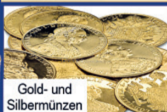
Gold- und Silbermünzen

Hochwertiger Schmuck mit Diamanten besetzt wird extra bezahlt