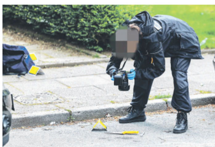
Zwischen dem schwarzen und roten Pkw ist ein Küchenmesser auf der Fahrbahn liegend zu sehen. Ob es sich dabei um die Tatwaffe handelt, wird nun geklärt.

Der Tatverdächtige ließ sich noch am Tatort widerstandslos von Polizisten festnehmen. Um die Hintergründe des Beziehungsdramas aufzuklären, richteten Staatsanwaltschaft und Polizei eine Mordkommission ein. Der tatverdächtige Ehemann wurde am Dienstag einem Haftrichter vorgeführt, der Untersuchungshaft anordnete. Wie Staatsanwalt Scheffels-Penders im CW-Gespräch mitteilte, wird dem türkischstämmigen Mann „nur“ gefährliche Kör-